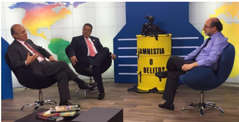
Foto: Participamos en el programa La Otra Cara de la Moneda de CableNoticias con los ex ministros del Medio Ambiente: Juan Lozano y Manuel Rodríguez Becerra, hablando sobre las conclusiones del debate FARC Enemigo Ambiental . (14 de Octubre de 2015)