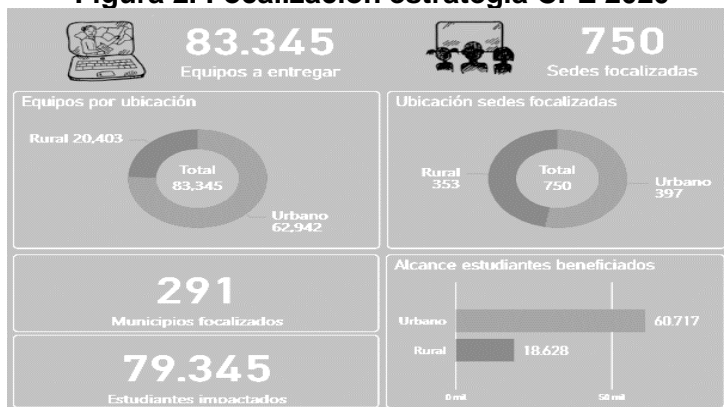
Figura 2. Focalización estrategia CPE 2020